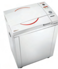
Laboratory autoclaves ranging in size and application