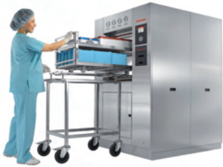
Esterilizadores de gran tamaño para distintas necesidades del mercado e industria

Tuttnauer presenta su gama de soluciones para esterilización, desinfección y limpieza: