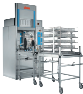
Lavadoras / desinfectadoras para hospitales y laboratorios