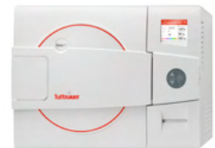
Pre & post vacuum tabletop sterilizers designed to perform class B cycles