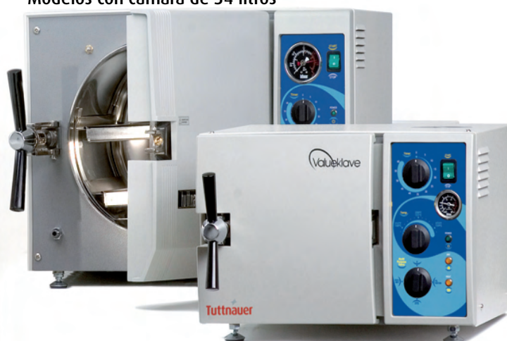
Modelos con cámara de 7.5 litros

Cumple con las más estrictas normas y directivas internacionales: