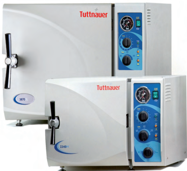
Modelos con cámara de 19 / 23 litros